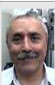
Berrocal 11301 Conductor HORTA

En el presente Volante vamos a intentar ayudar a los compañeros de nuevo ingreso y de paso que sirva de recordatorio para todos nosotros.