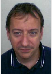
Ruiz 10700 Conductor Z. FRANCA

Dictador es el que no quiere que se defiendan los intereses de los trabajadores, dictador es el que espía a los demás en beneficio de la empresa, el que se opone a que tengamos presidente del Comité, el que pretende conservar los privilegios individuales en perjuicio de los demás, el que coacciona la libertad de expresión de los compañeros, el que les engaña, eso si es un dictador.