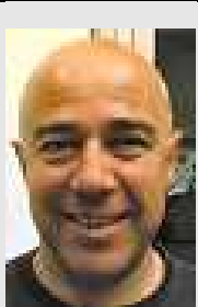
Cabrera 12268 Conductor TRIANGULO

Resulta que agreguen a un conductor y aquí no pasa nada, hace unos días agredieron a una maestra en un colegio de Badalona y el centro cerró las puertas ese día. En esta empresa hasta el medico te dice que estas expuesto a ello y si no te gusta ya sabes la puerta esta abierta, ¿no deberían tomar medidas para intentar solucionar estos problemas de agresiones?, se han pedido mamparas ya hace tiempo, ¿tendrá que pasar una desgracia para que tomen medidas?