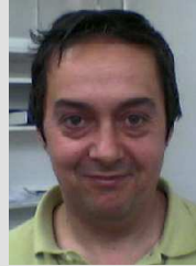
Pubill 10992 Conductor TRIÁNGULO

Se están viendo muchos problemas con este convenio que antes no ocurrían y que desde este sindicato se están preparando demandas contra TB y los firmantes.