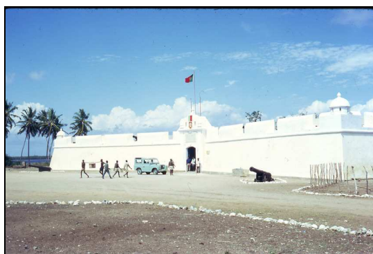
Fig. IV- Fortaleza servindo de prisão política. Foto de Carlos Bento de 1971

Nos últimos anos do regime colonial português serviu de prisão política e de local de tortura e de morte(Fig.IV).