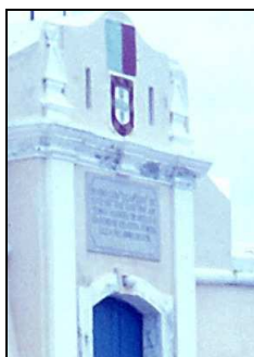
Fig II.- Réplica da lápide colocada por cima da porta principal.