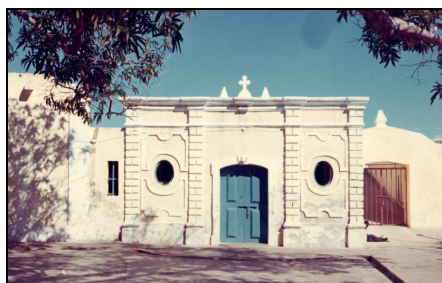
Fig. III. Capela militar de S. João Baptista

Esta fortaleza, dedicada a São João Baptista, padroeiro da ilha do Ibo, foi construída em pedra talhada, extraída localmente 13 , tendo no seu interior sido erguida uma capela militar ( Fig.III ) que, depois de ali ser colocada a imagem daquele Santo 14 , foi, convenientemente, ornamentada 15 .